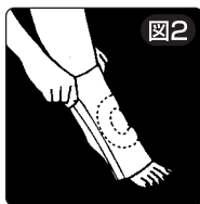
図2 円形シリコンインサートが膝蓋骨を囲むように装着します。