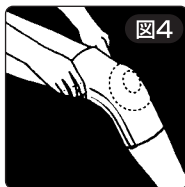
図4 快適に装着できるまで必要に応じて調整してください。